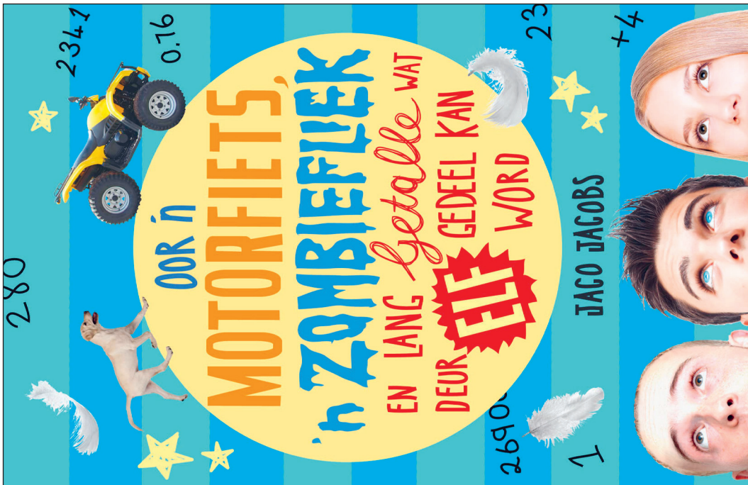
Afrikaanse versie (originele versie)

Vertaling titel: "Over een motorfiets, een zombiefilm en lange nummers die door elf gedeeld kunnen worden"