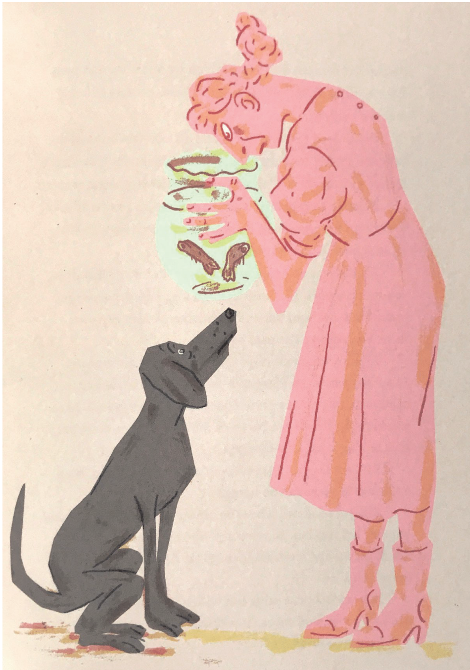
Vissen of 'kleine rooie jongens' geportretteerd op pagina 63