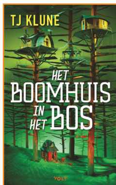
Het boomhuis in het bos TJ Klune Anneke Bok (vert.) Volt