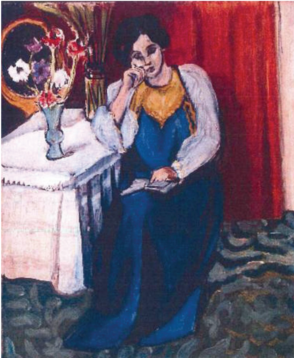
Henri Matisse: 'la Liseuse en Blanc et Jaune' (1919)